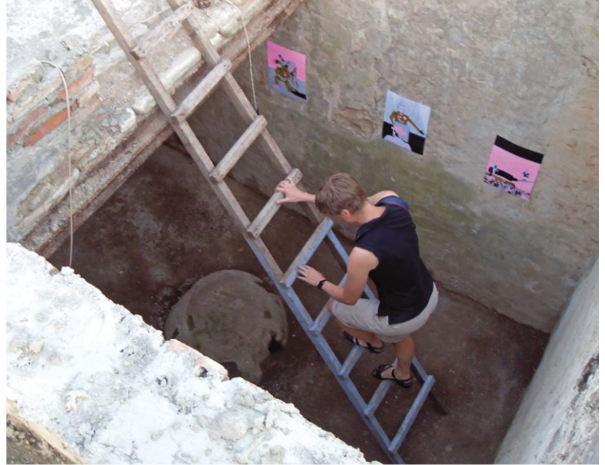
“SOLDIER IN RESIDENCE”, 2009, INSTALLATION, ART VILLA GARIKULA “SOLDIER IN RESIDENCE”, 2009, ინსტალაცია, არტ ვილა გარიკულა

Der unterirdische Raum war zu Zeiten der Marmeladenfabrikation entweder eine Drainage oder ein Kühlraum. Da es in der Art Villa Garikula an Ausstellungsräumen mangelt, ist dies ein neuer Raum, der aufgrund seiner starken Ausstrahlung zu site-specif-artigen Videoprojektionen oder Installationen inspirieren kann. (Isabel Becker)