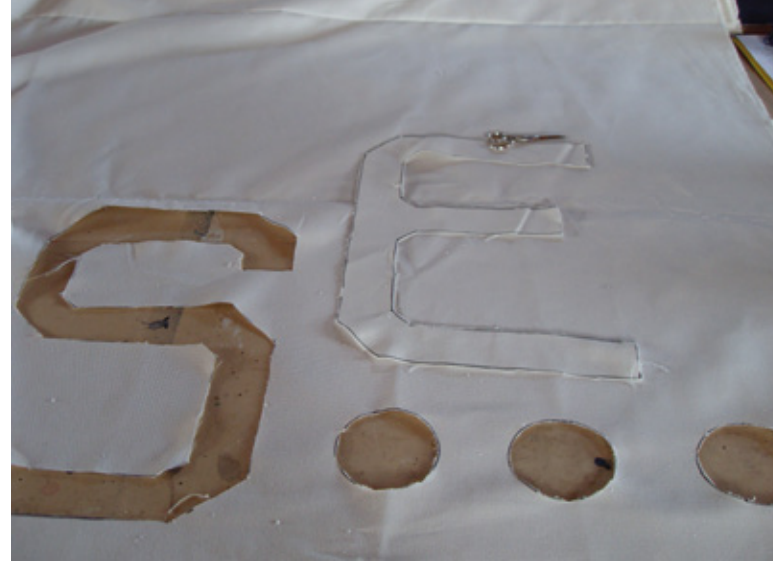
S. 29; „LICHTPAUSE“, 2009, INSTALLATION AN DER SÜDSEITE DER ART VILLA GARIKULA TEXTILSTOFF - GEFÄRBT, METALL-ÖSEN; 480 X 320 CM

Ist es überhaupt möglich, so könnte man fragen, einen eigenen Weg zwischen den Machtinteressen Russlands und denen der USA zu finden? Was lohnt sich zu übernehmen, und was kann man der Kolonialisierung des Lebensstils entgegen halten?