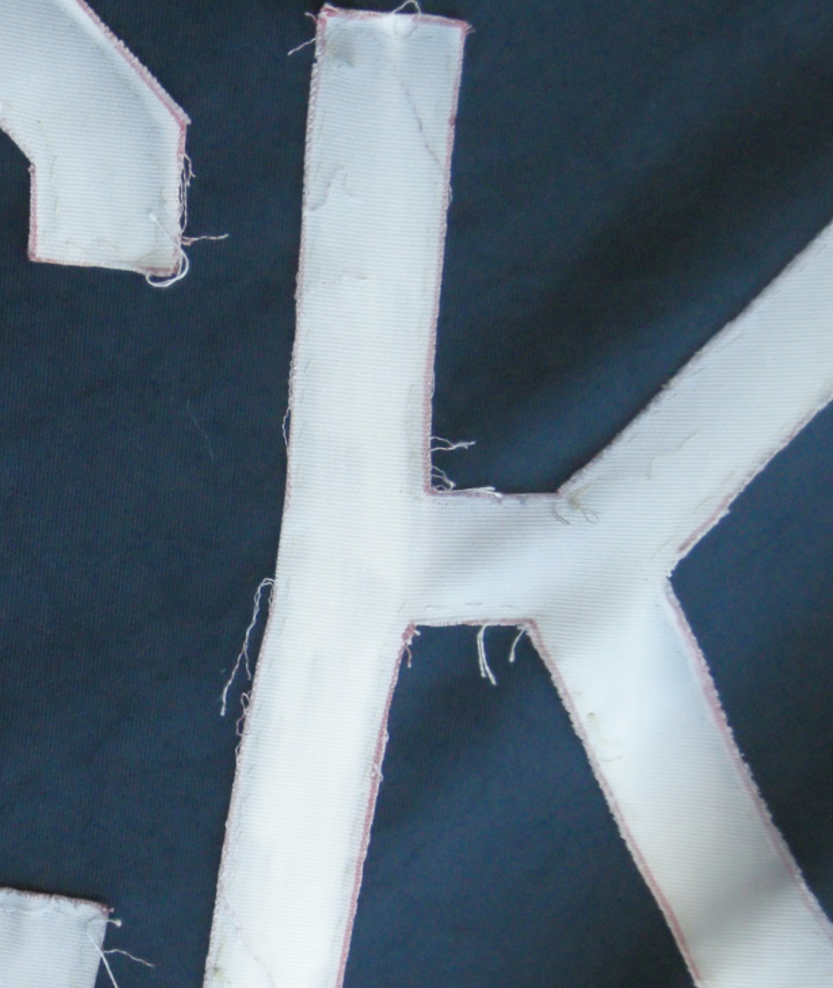
„LICHTPAUSE“, 2009 (DETAIL)