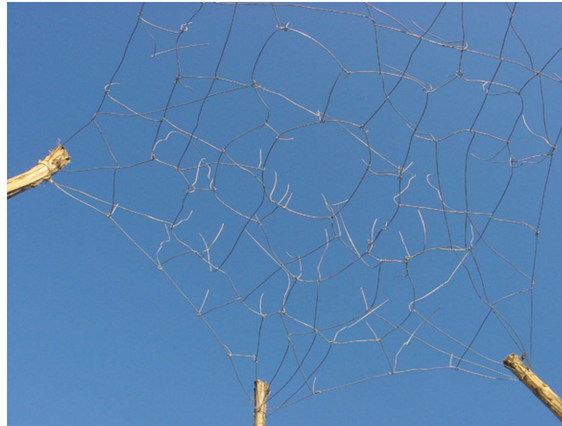
O.T. (PAVILION), 2009

Die Form spiegelt Bretterbauers langjähriges Interesse am Kreis, man mag sich an seine Arbeiten mit Fallschirmen, kreisrunden Teppichen oder ebensolche Ausschnitte in Teppichen erinnern. Die Wiederholung der Form ermöglicht den Blick auf sie als Musterung. Eine Form zeigt die Musterung von Abstraktion, sie räumt