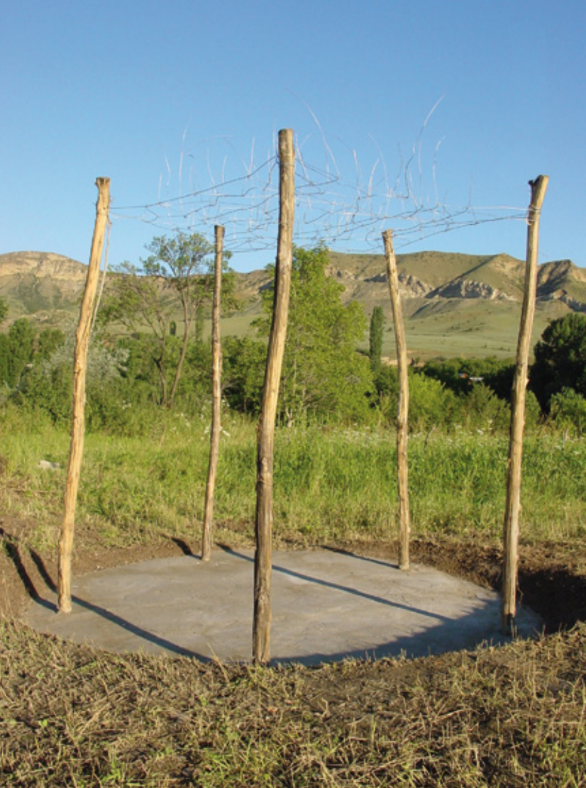
O.T. (PAVILION), 2009 MATERIAL: BETON, HOLZSTÖCKE, DRAHT GROSSE: HOHE CA 250 CM, DURCHMESSER CA. 350 CM