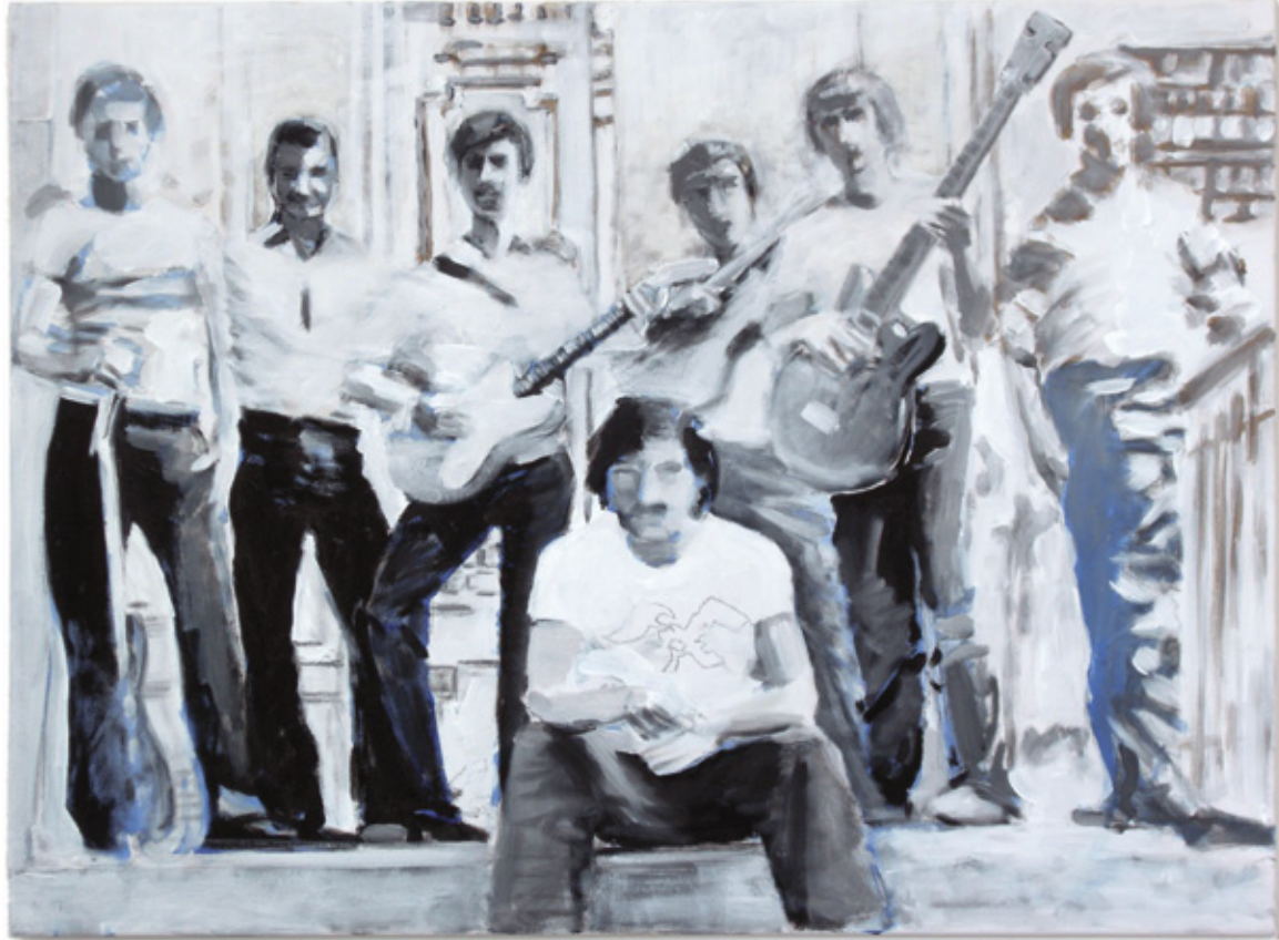
BAND „NOTE“, KULTURZENTRUM AKHALKALAKI, 1980 ACRYL/LEINWAND, 60X80CM, 2010