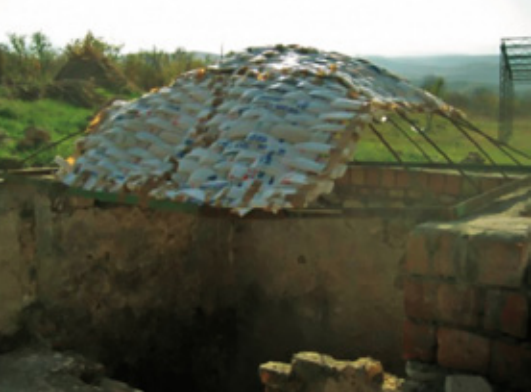
“SOLDIER IN RESIDENCE”, 2009 INSTALLATION, ART VILLA GARIKULA