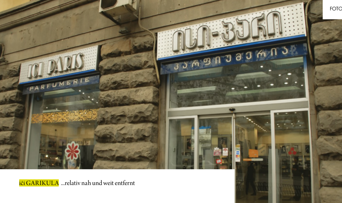
ICI GARIKULA ...relativ nah und weit entfernt